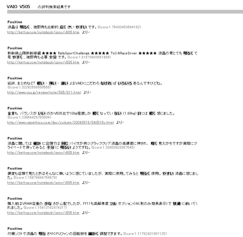
図 2 評判抽出の例

前章までで述べた文書分類の手法を基にして、実際に Web から評判を抽出するシステムを試作した。システムの概要について以下に述べる。Crawling 部分については、今回は GoogleAPI を用い Google のデータベースを利用することとした。評判を検索する際には、利用者はノート PC のマシン名やその一部 5 をクエリとして入力する。クエリとして入力された文字列に「intitle:レビュー OR intitle:レポート」を付加したものを、Google へのクエリとして送信し、検索の結果得られた URL にアクセスし、HTML を入手する。入手したページのテキストを文単位で、PN 分類器にかける。得られたスコアの絶対値が上位の文から順に表示する。実際に、クエリ「VAIO V505」で評判を抽出した際の結果を図 2 に表示する。